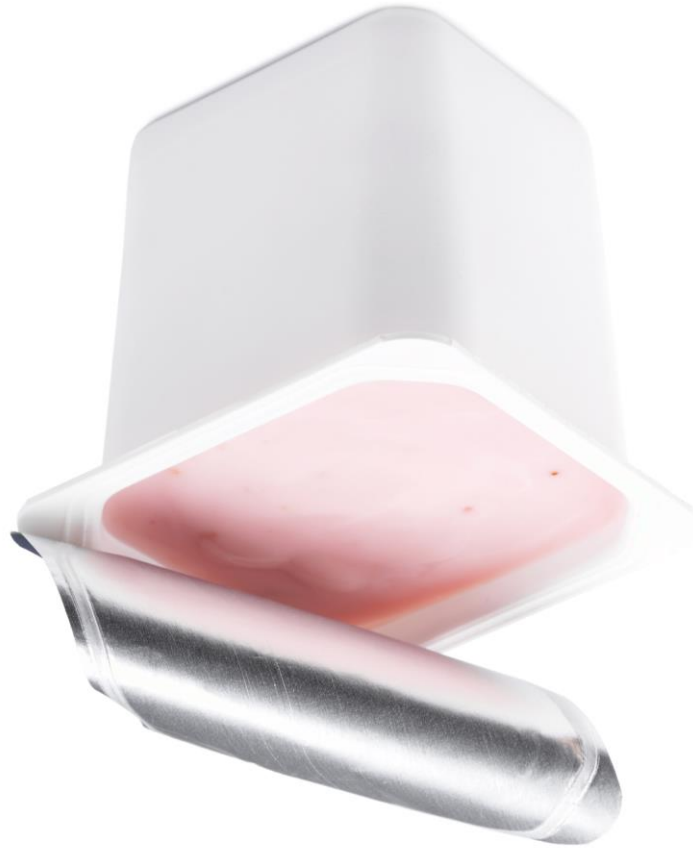
Abb.: © pogonici - Fotolia