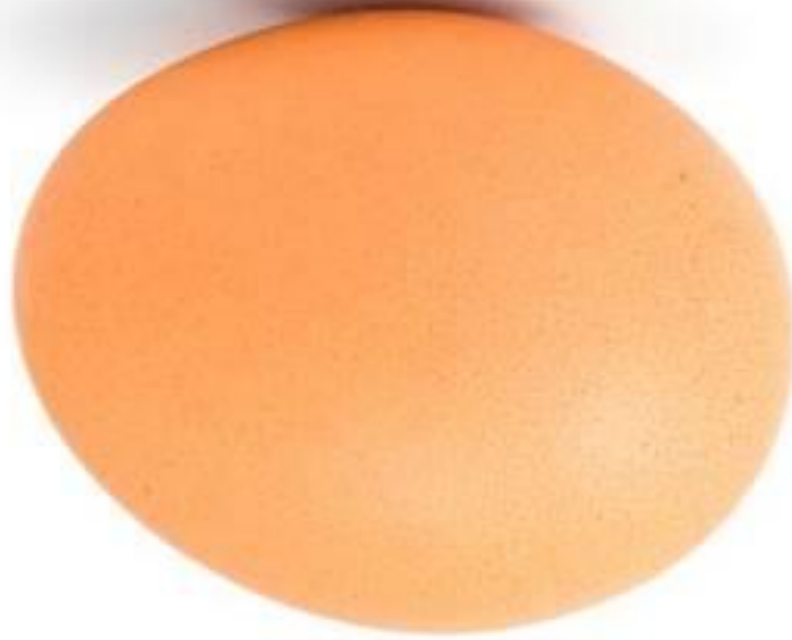
Abb.: public domain